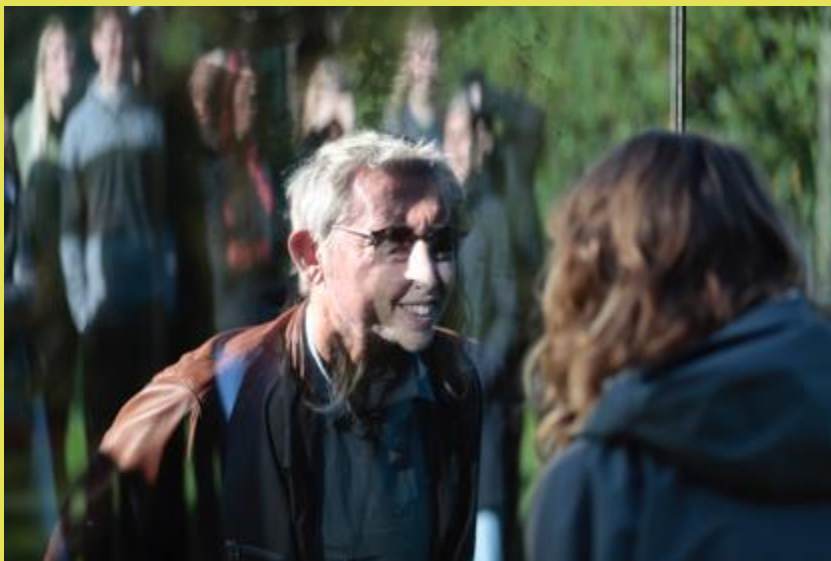
Dan Graham, Two Different Anamorphic Surfaces , 2000.