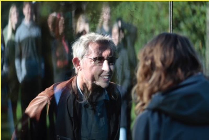
Dan Graham, Two Different Anamorphic Surfaces , 2000.